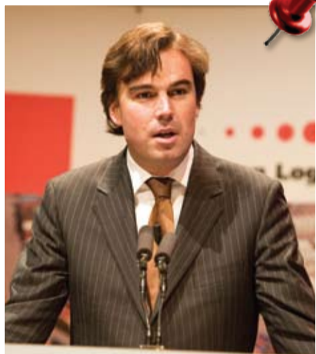
De Ondernemersprijs wordt uitgereikt door minister Eurlings.

'Een goede spiegel laat je verder kijken.' Dat was het thema van de Algemene Ledenvergadering en het congres van Transport en Logistiek Nederland. In november vorig jaar was de organisatie voor het wegverkeer te gast in het World Forum.